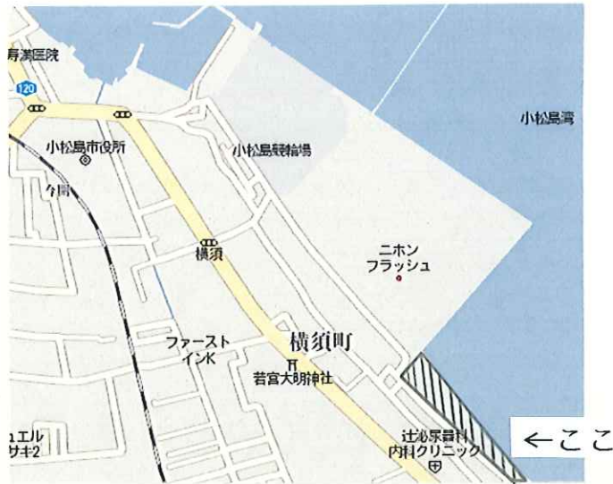
清掃美化活動実施場所